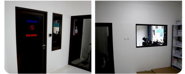
Pekerjaan Perluasan Kantor PT Demaz Noer Abadi