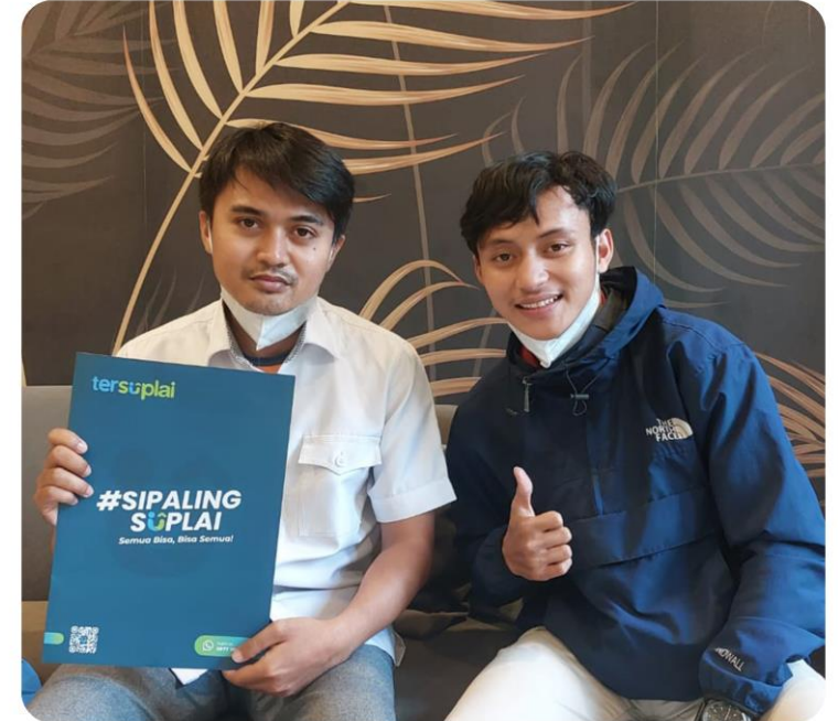
Pengadaan Office & Cleaning Supplies ABS Group