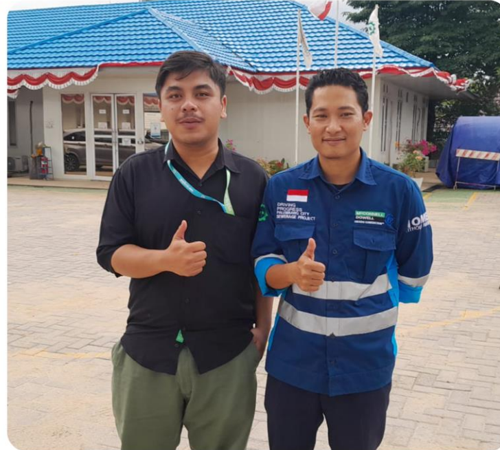
Pengadaan Material Konstruksi & Logistik McConnell Dowell Indonesia