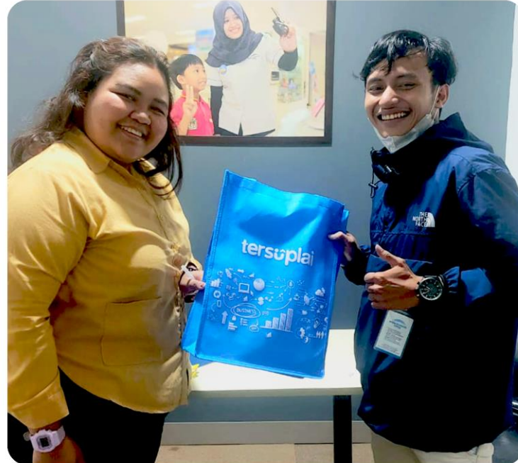
Pengadaan Office Supplies & Logistik Electronic City