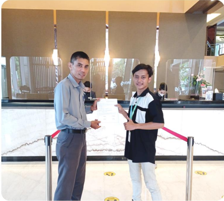
Pengadaan Furnitur & Alat Dapur Patra Jasa Cirebon