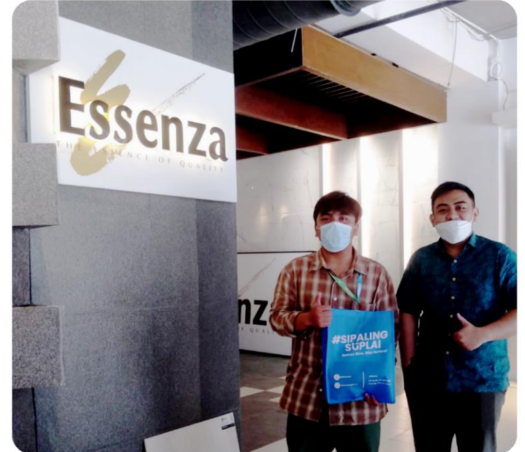
Pengadaan Ban Truk PT Internusa Keramik Alamasri (Essenza)