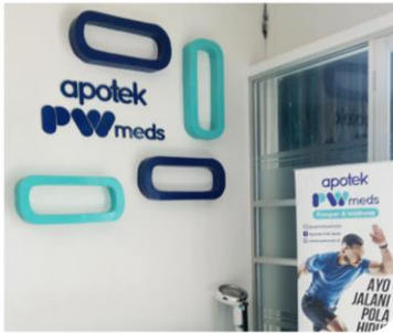
Pekerjaan Interior & Eksterior Apotek PW Meds