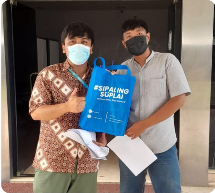
Pengadaan Lemari Besi PT Anugerah Alam Persada